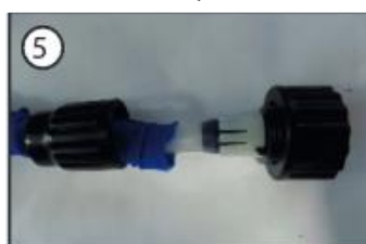
5) Uzlieciet atpakaļ savienotāj uznavu, uzmanieties, lai savienots cieši.