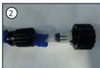
2) Pavelciet savienotāj uznavu un noņemiet ventīli.