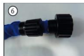
6) Pārvelciet pāri zilo lateksa materiālu un saskrūvējiet uznavu ar ventīli.

Izplatītājs: SIA TV PRODUCTS, Vienotais reģistrācijas numurs: 40203261904. Jautājumu vai pretenziju gadījumā, lūdzu, rakstiet uz: info@tv-shop.lv un mēs centīsimies atrast risinājumu.